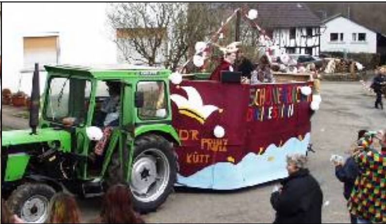
Karneval 2004: Schenkkreis-Schneeball und Prinzenwagen.