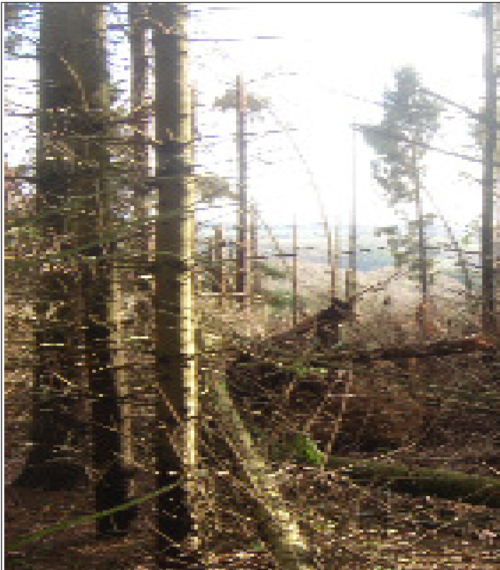
Einst "Hedwigs Wäldchen": Zu 90% zerstört, hier ein freier Blick von der Weide oberhalb auf Oettershagen und Langenberg. Auf dem Weg aus dem Dorf zum Hochsitz liegen ca. 30 Bäume quer auf die unteren Weiden. Morgen wollen die Jungs aus dem Dorf sägen...