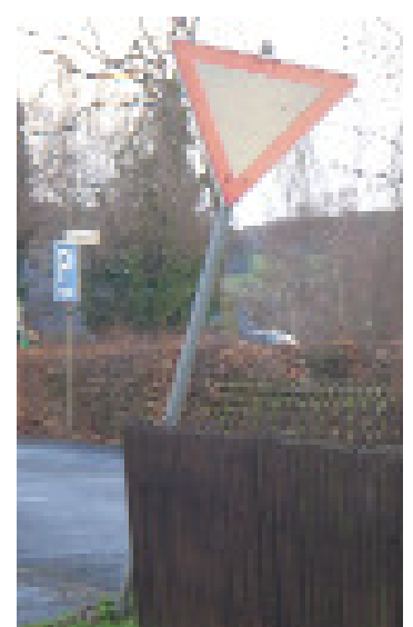
Noch mehr geneigt